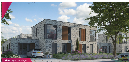
Rhobi 8 patio-woningen