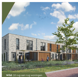
Wild: 10 rug-aan-rug-woningen