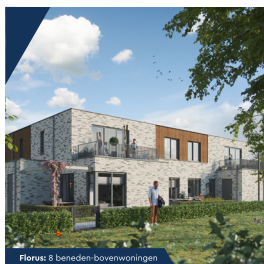
Florus: 8 beneden-bovenwoningen