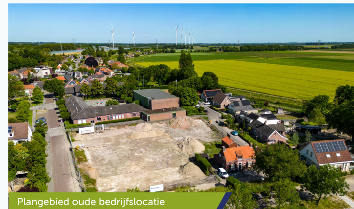
Plangebied oude bedrijfslocatie

Appartementengebouw is ruim opgezet en de woningen hebben een flexibele indeling. Het gezamenlijk groen met verschillende planten en struiken geeft een fraai uitzicht vanuit beide woningtypes. Een fijne plek om te wonen!