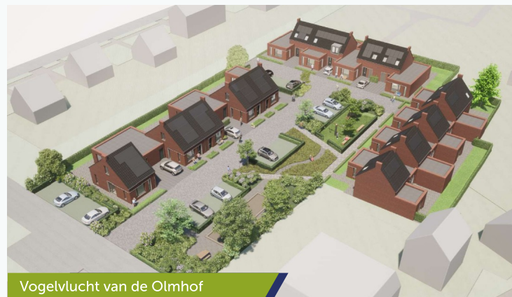
Vogelvlucht van de Olmhof

Op dit moment zijn er nog enkele woningen beschikbaar. Naar verwachting zullen wij na de zomerperiode met de resterende overgebleven woningen in de verkoop gaan.