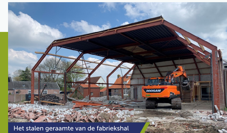
Het stalen geraamte van de fabriekshal

De oude bedrijfslocatie is recentelijk gesloopt. Op 9 maart hebben wij met onze (oud) medewerkers, welke op deze locatie werkzaam zijn geweest, samen herinneringen opgehaald. Medio februari is de verkoop van de Huiszwaluw woningen en Zwaluw appartementen gestart. Begin 2024 staat de realisatie van dit mooie plan gepland.