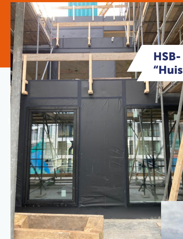
HSB- gevelementen in “Huis 1” van Hyde Park