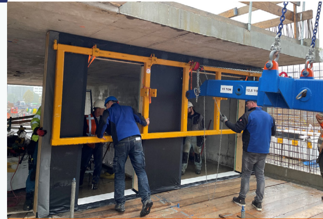
Montage van een Zwaluwe Prefab HSB gevelement in HydePark “Huis 1”. Met een speciaal ontwikkelde ingenieuze evenaar worden de elementen onder de balkons geschoven.

Overzicht van “Huis 1” t/m “Huis 6” dat KBM bouwt in Hoofddorp en waarvan Zwaluwe Prefab alle HSB- gevelementen levert. De Katwijkse Bouw Maatschappij bouwt er 310 woningen. Zwaluwe Prefab levert hiervoor ruim 750 gevelementen. Deze maand werd het 400e element afgeleverd op project “Hyde Park”.