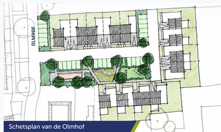
Schetsplan van de Olmhof

Medio 2021 hebben Zwaluwe Ontwikkeling en een lokale groep met gezinnen van middelbare leeftijd samen de handen ineen geslagen om 13 levensloopbestendige woningen te ontwikkelen. De afgelopen periode hebben er veel ontwerp vragen de revue gepasseerd. Samen met Quadrant Architecten is er een verkavelingsplan opgemaakt en zijn woningplattegronden op basis van hun woonwensen samengesteld.